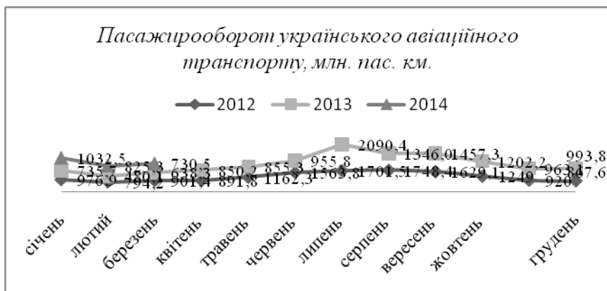
Рис. 2. Пасажирооборот українського авіаційного транспорту [за даними 11]

Якщо звернути увагу на пасажирооборот за українським авіаційним транспортом, то за ним спостерігається збільшення у порівнянні з 2013 та зменшення по відношенню до 2012 року (Рис.2).