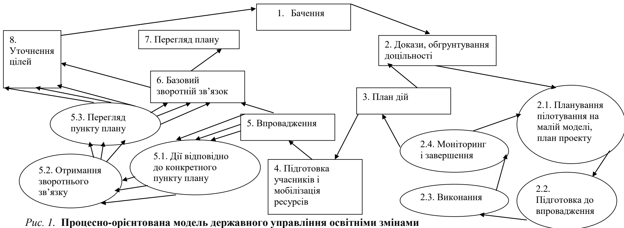
Рис. 1. Процесно-орієнтована модель державного управління освітніми змінами