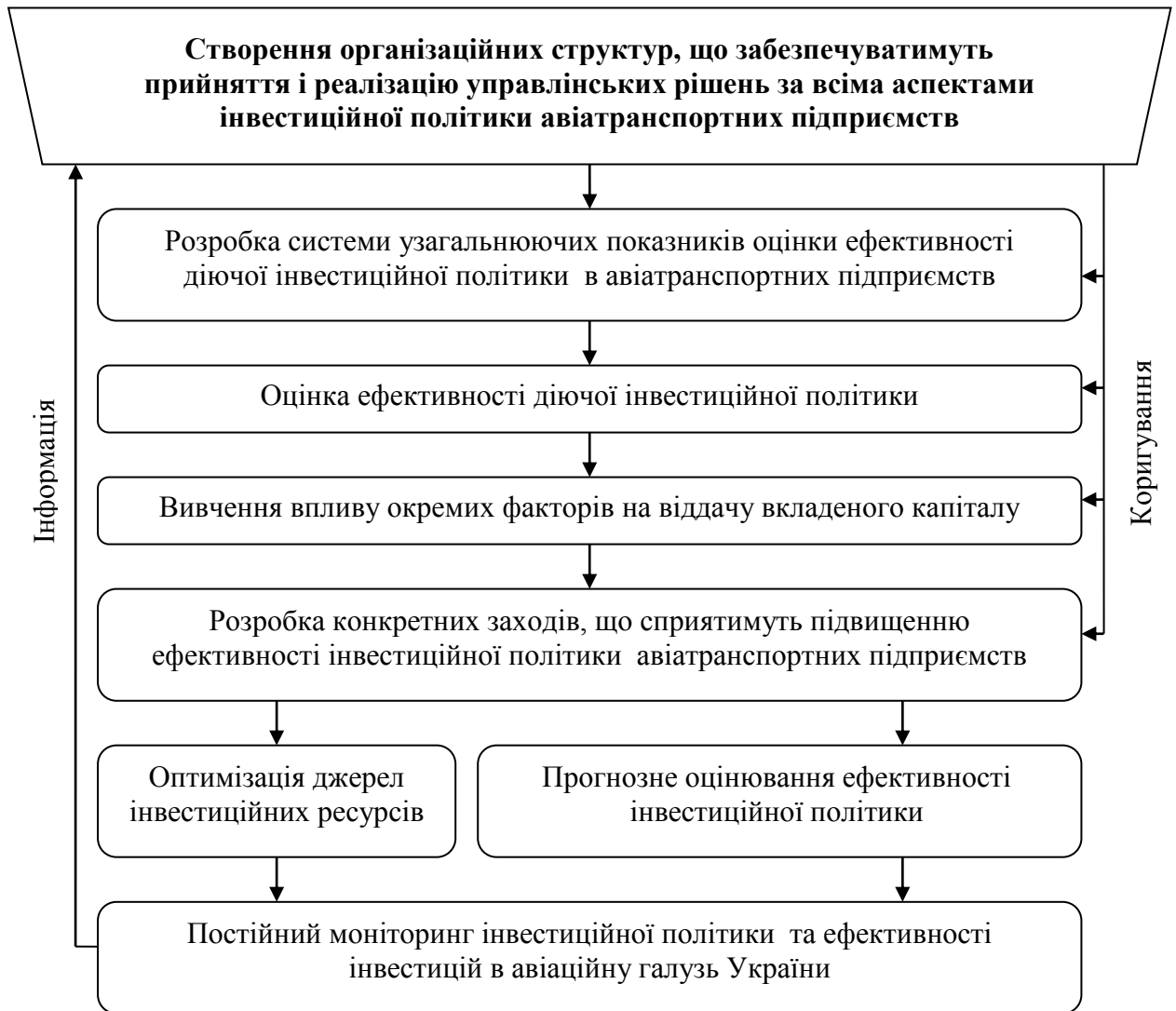
Рисунок 2. Організаційна схема підвищення ефективності інвестиційної політики авіатранспортних підприємств

Одним з найважливіших елементів даної схеми є вивчення впливу окремих факторів на віддачу вкладених ресурсів та виявлення резервів підвищення ефективності інвестиційної політики авіатранспортних підприємств.