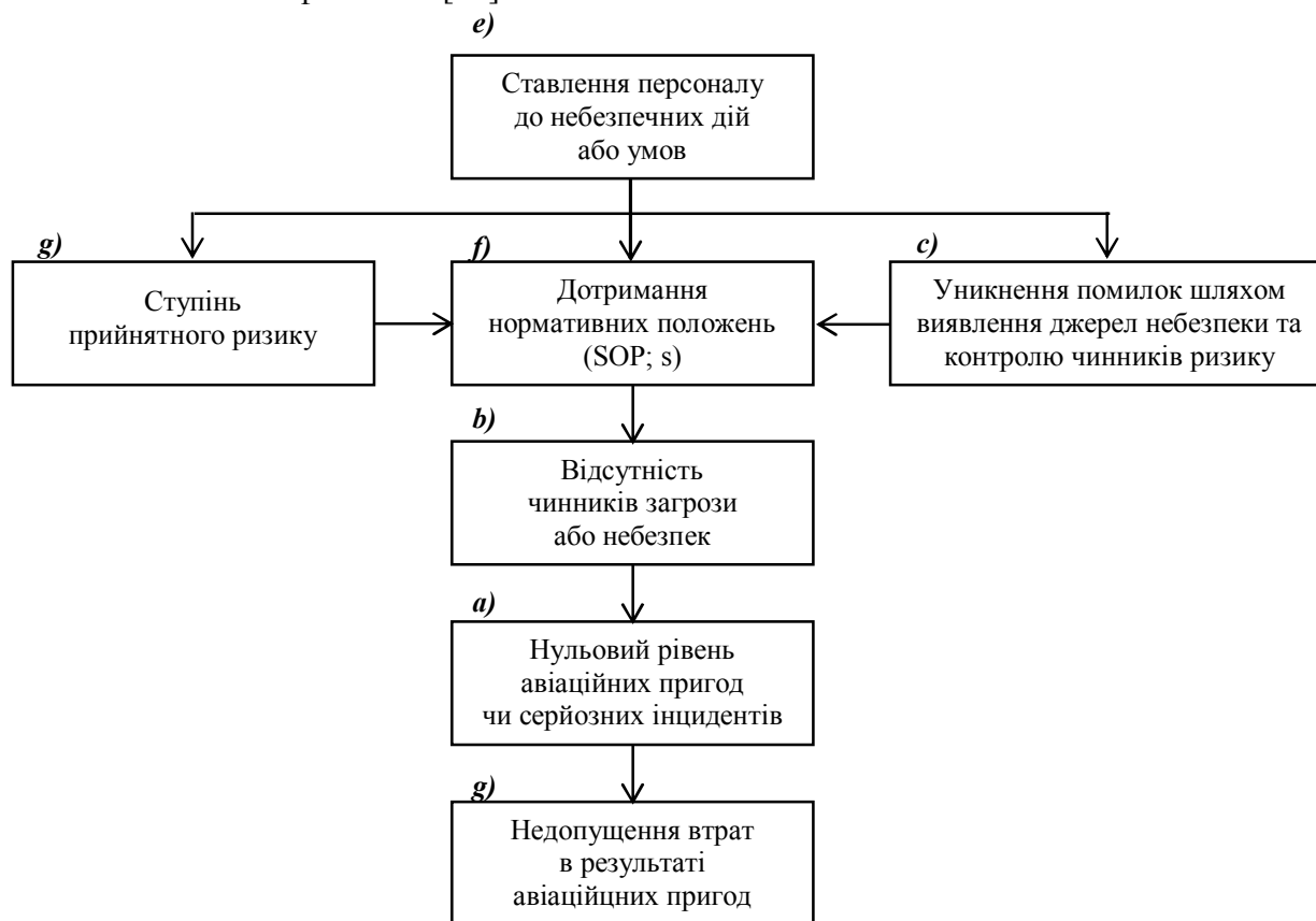
Рисунок 1 – Подання взаємодії складових концепцій безпеки ІКАО через призму стикання / нестикання блоків «суб'єкт – процедури» моделі SHEL

Таким чином, якщо «ставлення авіаційного персоналу до небезпечних дій або умов» професійної діяльності є головним логічним поясненням негативного впливу ЛЧ на БП, то питання виявлення цього самого «ставлення» є актуальним і нагальним. Тому вважаємо доцільним звернутися до практики розслідування АП, з якої випливає обов'язкова процедура виявлення в учасників АП [16]: