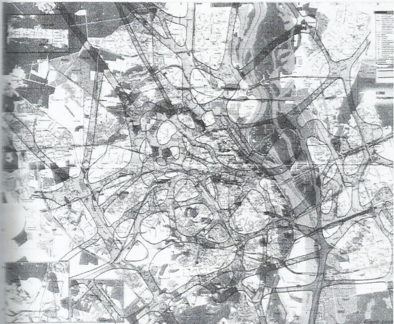
Рис. 1. Фрагмент карти розломів Києва 5

Головним завданням перед прийняттям рішення про доцільність придбання земельної ділянки і початку її ландшафтної реорганізації, стає визначення загальної геопатогенної ситуації шляхом експрес діагностики (визначення, наскільки інтенсивно гепатогенне випромінювання, щільність сіток та наявності чи відсутності розлому).