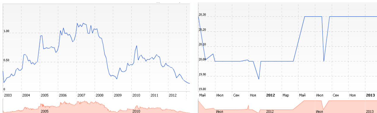
Динаміка вартості акцій ПАТ «Укртелеком»

кон'юктурою на фондовому ринку – загального скорочення попиту на акції компаній, варто відзначити негативні тенденції останнього кварталу 2012р. за усіма напрямками операційної діяльності оператора: скорочення доходів міжміського і міжнародного зв'язку (на 3,9% на рік), незначне зростання надходжень від Інтернет послуг (2,1% на рік), відтік абонентів в результаті підвищення вартості телекомунікаційних послуг.