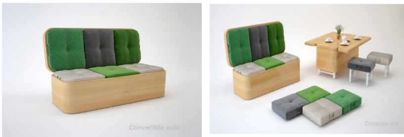
Рис. 3. Диван-трансформер «Convertible Sofa»

Каркасний тип конструкції має характерну жорстку раму чи інший каркасний елемент, що має обмежений діапазон рухів. Основна перевага такого типу конструкцій – це надійність, довговічність та простота у використанні, який легко трансформується. Таким прикладом меблів-трансформерів являється диван «Convertible Sofa», що створений українським дизайнером Юлією Кононенко. Простий з вигляду, він легко перетворюється у місткий стіл і кілька м'яких пуфів. Практичне рішення для молодіжних інтер'єрів і навіть офісних приміщень, де так часто не вистачає елементарного затишку і місць для відпочинку (рис. 3).