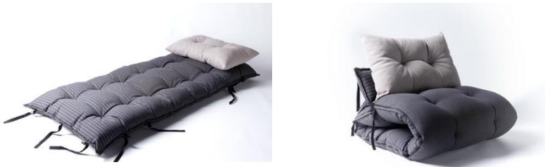
Рис.4. Матрац-крісло «Teb Bed»

В тісних житлових умовах безкаркасні конструкції меблів мають значний попит. Такі меблі можуть використовуватися в обмежених умовах, для гостьового варіанту та для тих, хто любить відпочивати на природі. Хорошим прикладом є матрац-крісло «Teb Bed», що створене Volen Valentinov і студії All In у Болгарії в 2013р. До матрацу додається пара подушок: трикутна і прямокутна, виготовлені вони з відходів тканини і набивання, які використовувалися для пошиття матраца (рис. 4).