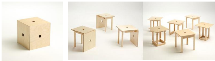
Рис. 1. Перехід форми до трансформації

він же перетворюється в парту, а стілець стає вище, а потім парта стає комп'ютерним столом. Крім цього, меблі-трансформери дають можливість звільнити простір в дитячій для ігор.