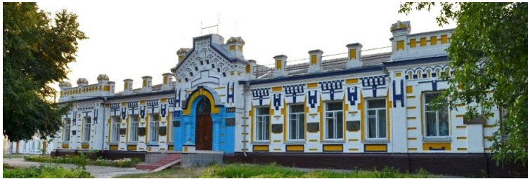
Рис.5. Богадільня 1907 – 1908 рр. в с. Германівка.