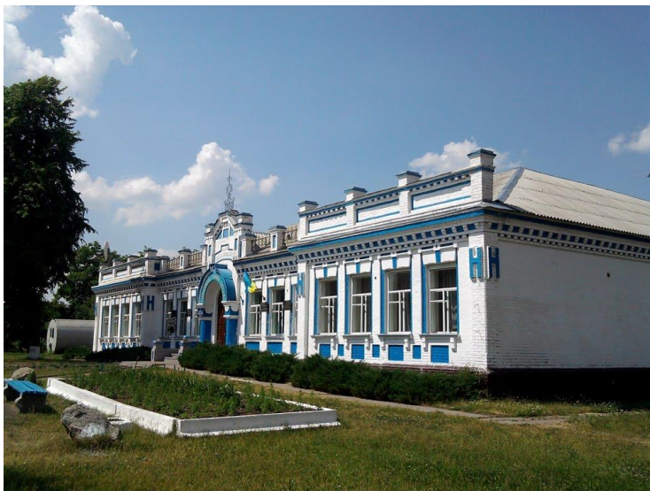
Рис. 2. Двокласне училище (гімназія) 1909 р. в с. Германівка.