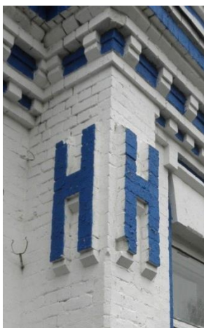
Рис.3. Літера «Н» на фасадах богадільні та двокласного училища