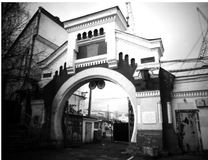
Рис. 1. Брама колишнього казенного винного складу на Деміївці. 1897.