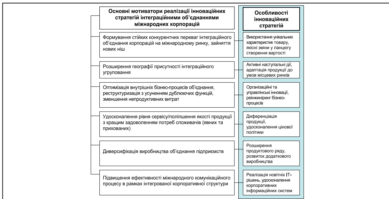
Рисунок 2. Мотиватори реалізації інноваційних стратегій інтеграційними об'єднаннями міжнародних корпорацій