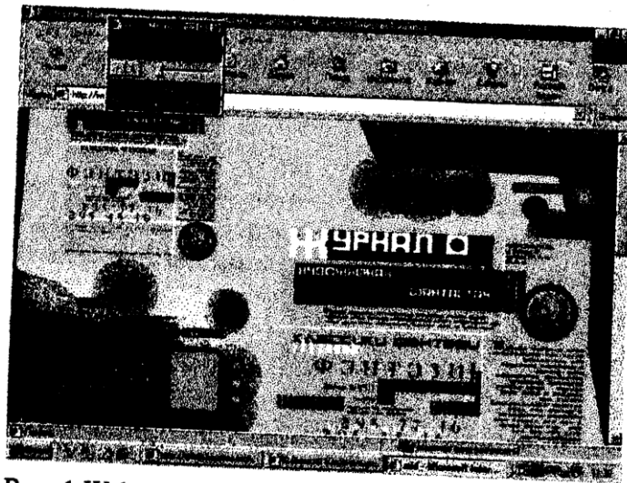
Рис. 1 Web-сторінка, робочий макет

Office 2000 – це остання версія популярного пакету програм, який працює під управлінням операційної системи Windows 95, Windows 98 або Windows NT та містить в собі шість додатків. Заслужовує на увагу нова багатоскладова розгорнута структура буферу обміну файлів, яка дозволяє одночасно вмістити до 12 фрагментів. Новим компонентом Office 2000 є програма Front-Page 2000. Front-Page 2000 – це редактор HTML-документів, за допомогою якого швидко створювати цілі Web-вузли та редагувати Web-сторінки, готуючи їх до опублікування в Інтернеті. В посібнику розглядаються засоби організації гіперпосилань на різні об'єкти локального диску комп'ютера та Інтернету.