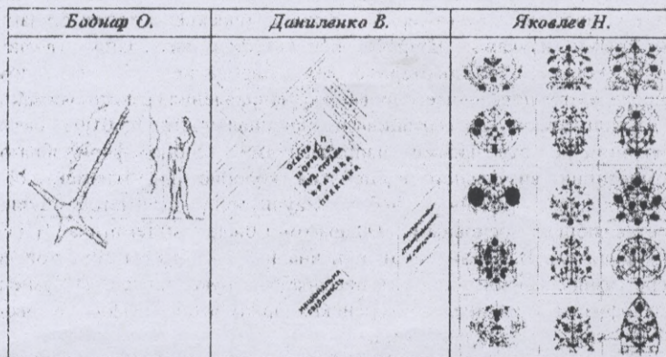
Рисунок 1 – Примеры иллюстраций тем научных теорий известных украинских ученых по специальности «Техническая эстетика» («Дизайн»)

В общем русле развития теории дизайна в мире необходимо отметить появление обобщающих теорий украинских ученых: О.Боднара, В.Даниленко, Н.Яковлева (рис.1). О.Боднар исследовал проблема взаимосвязи геометрических пространственных представлений в искусствоведении, связал явление филотаксиса, чисел Фибоначчи и модуляра Ле Корбюзье. В. Даниленко изучил дизайн Украины в мировом контексте художественной проектной культуры XX века (национальный и глобализационный аспекты). В настоящий момент углубляет данный вопрос по странам Европы. Н.Яковлев сформулировал геометрические принципы художественного формообразования.