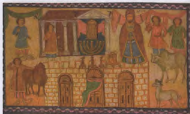
Рис. 1. Синагога в Дура Європос (200 р.)