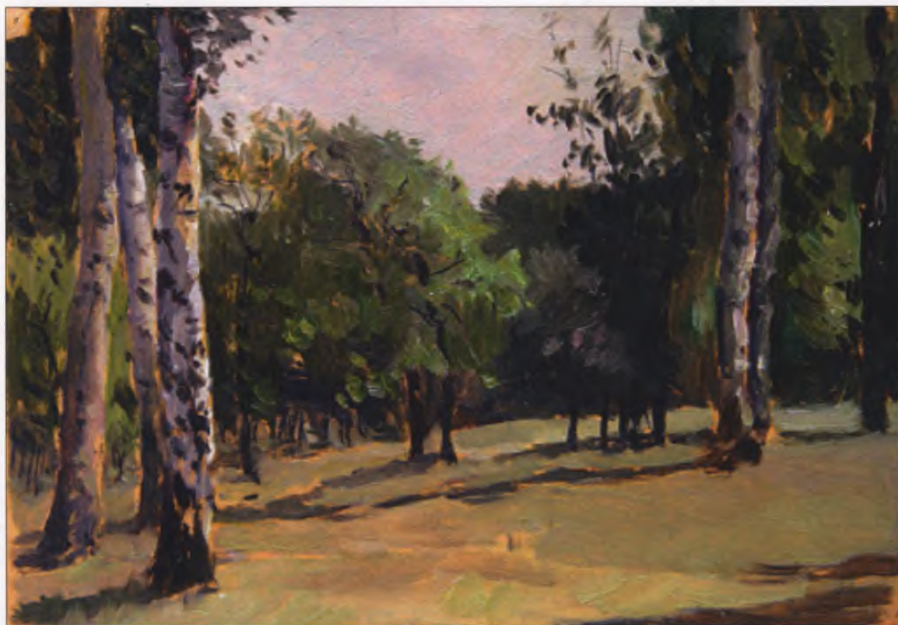
Кокель О.О. Харківський парк. 1953