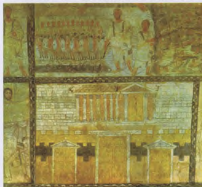
Рис. 2. Домашня церква в Дура Європос 232-256 рр.