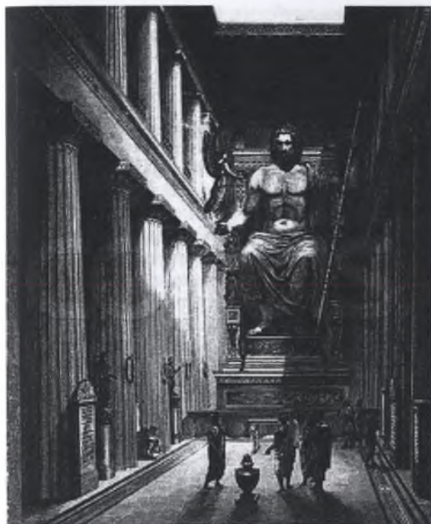
Рис. 3. Реконструкція статуї Зевса роботи Фідія, що була одним із величних священних приношень святилища Олімпу

малочисельними спільнотами, християни не потребували великих будівель, які б містили якісь зображення; більшість з християн були бідними людьми, що не могли собі дозволити замовити твір мистецтва; переслідування з боку влади; поганський митець не міг творити щось для християн, якщо він не порвав з поганським світом.