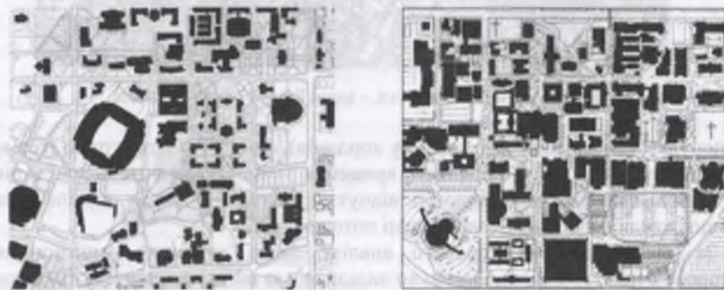
Рис.6. Просторовий аналіз для територій ВНЗ. Ліворуч – Університет в Обурні, праворуч – Державний Університет Арізони. Чорним позначені будівлі, білим – вільний простір між ними.

Методи просторового аналізу все частіше використовуються як для вирішення нагальних містобудівних завдань (рис.7), так і для розробки конкретних фрагментів міського середовища.