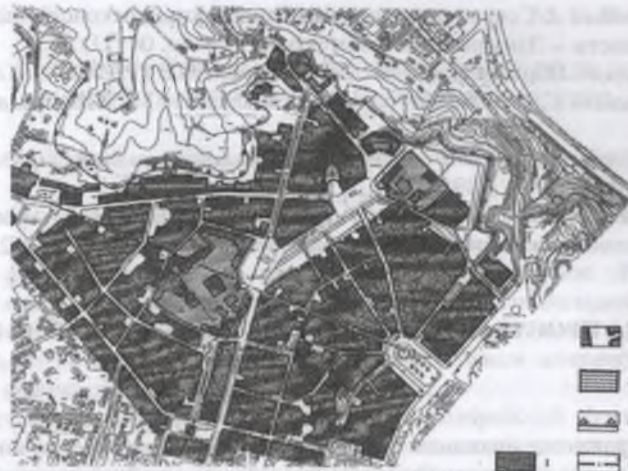
Рис.7. Просторовий аналіз охоронної зони Софії Київської (за Є.Водинським, О.Кондратенко): 1 - замкнуті простори кварталів, 2 - транзитні простори, 3 - територія цілісного утворення - заповідника «Софія Київська», 4 - окрайка рельєфу і візуальний фронт, 5 - межі охоронної зони.