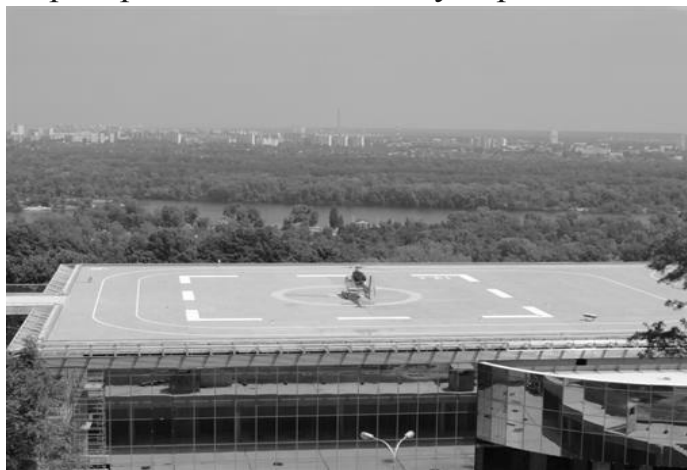
Рис. 2. Вертодром Дніпро 1 (м. Київ)

Президентський вертодром (Дніпро 1) розрахований на прийом важких вертольотів вагою до 13 тонн, сертифікованих по категорії А, зокрема, Мі-8, які експлуатуються Міністерством надзвичайних ситуацій. Конструктивна частина вертодрому, а також кілька рівнів підпірних стін вздовж ділянки спроектовані так, щоб укріпити схили і не допустити сповзання ґрунту. Сам вертодром розташований на даху торговельного центру (рис. 2).