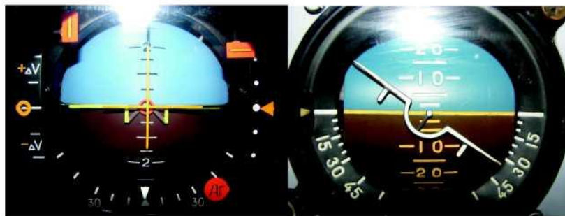
Рис. 1. Авиагоризонт с типом индикации «вид с воздушного судна на землю»

«Вид с воздушного судна на землю» (рис. 1).