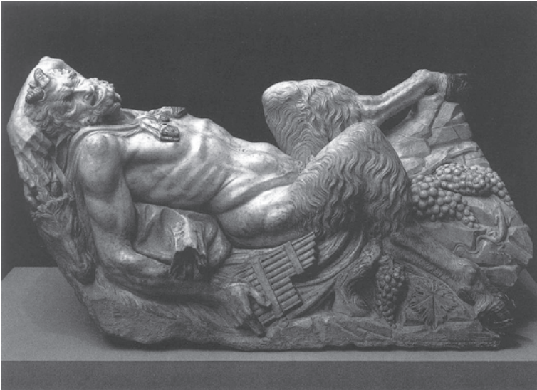
Рис. 5.

те и невыразительности, ибо Майоль – представитель импрессионизма в скульптуре, который «не болел» такими недостатками. Тем не менее, можно брать на себя ответственность утверждать, что майолевская «Река» является своеобразной бронзовой «реинкарнацией» «Отчаяния» Монторсоли, появившейся на свет почти четыреста лет спустя, при чем – менее драматичная и гораздо более пустая в силу иного звучания и программы. Даже по назначению эти скульптурные образы могли быть идентичными – оба, возможно, символизируют реки, один предназначался для фонтана, да и второй установлен на воде. Подобные параллели можно проводить не раз, но данная – аниболее показательна и симптоматична.