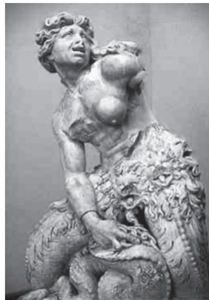
Рис. 2. Источник [4]