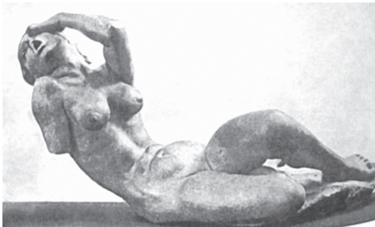
Рис. 4. Источник [2]

Разве на рубеже XIX и XX вв. те же ноты экспрессивного отчаяния, «приправленные» органической вписанностью в окружающий ландшафт, не повторяются в скульптурах А. Майоля («Ночь», «Флора», «Средиземное море»)? Трактовка образов, грубое, массивное тело женщины со слишком тяжелыми ногами, одутловатые формы, тяжелые пропорции – все это комплекс черт майолевской «Реки» (1939–1943 гг.), вновь воспроизводящий в памяти образ bozzetto работы Монторсоли. Но в контексте разговора о Майоле обычно не говорится о внутренней пусто-