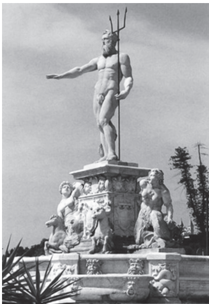
Рис. 1.

Его итальянские периоды были очень плодотворными, и, по свидетельствам Дж. Вазари, он имел успех. Скульптор украшал церкви (церковь Сан-Маттео в Генуе), гробницы (гробница А. Аретино в церкви Сан-Пьетро в Ареццо, гробница Саназзаро в Модене), пробовал себя в портретном жанре (бюст Т. Кавальканти), как декоратор (отделка Мессинского фонтана). Если портретные образы ему не очень удавались, то декор фонтана «Нептун» Монторсол и (1557 г., рис. 1) вобрал в себя лучшие тенденции маньеристической скульптуры, от макси-