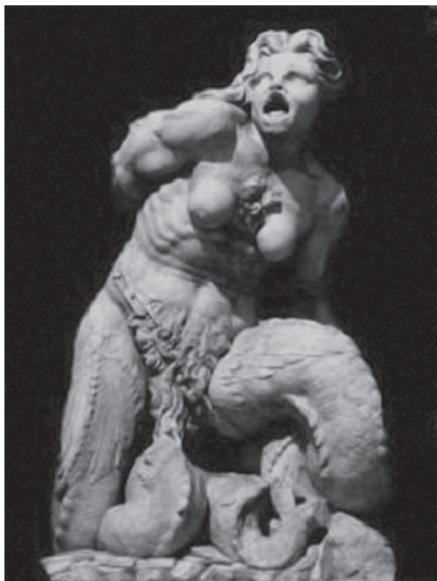
Рис. 3. Источник [4]

мальной усложненности композиционного решения (ведь не зря Вазари упоминает, что этот фонтан легче нарисовать, чем описать словами) до богатства подачи одиночных образов. Сам образ Нептуна исследователи обычно называют неудавшимся [7]. Зато очень показательными с точки зрения выражения маньеристического настроения, тяготения к уродливому, боли и отчаянию являются фигуры Сциллы (1557 г., рис. 2) и Харибды (1557 г., рис. 3), контрастирующие с глыбой покоя статичной вертикали Нептуна.