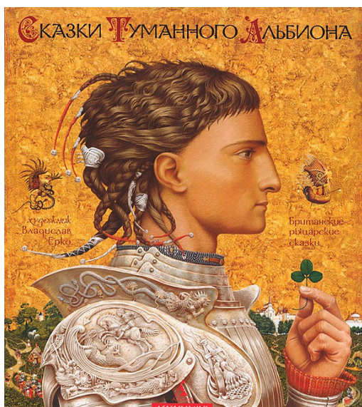
Рис. 3 Казки Туманного Альбіону [22]

Книги, створені з урахуванням ілюстрацій Ерко, вражаючі. Тонке відчуття матеріалу, чудова робота з фактурами та неймовірне опрацювання деталей змушують дійсно повірити в казку.