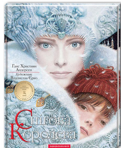
Рис. 2. Книга «Снігова королева» [14]

Складні, фантазійні, романтичні ілюстрації В.Єрка не одразу були сприйняті видавництвом, надто несхожі вони були на звичні ілюстрації до казок, але час показав, що художник мав рацію: «Снігова королева» Андерсена з його ілюстраціями (рис.2) двічі видавалася англійською мовою і в 2005 році потрапила до трійки найбільш продаваних книг в Англії напередодні Різдва. Напевно, даремно, Пауло Коельо, коли на одній англійській книжковій виставці побачив проілюстровану Владиславом Єрко книгу «Снігова королева», зізнався, що «це найдивовижніша дитяча книга, яку я коли-небудь бачив у своєму житті...» [22].