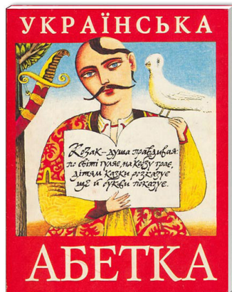
Рис. 1. Українська абетка (старе видання) [14]

ту. Оригінальний текст або переклад неодмінно мав поєднуватися з чудовими яскравими малюнками та якісною поліграфією. Дитяча книга від «Абабагаламага» завжди була коштовною — і за якістю виконання, і за ціною, а відтак — і за суспільним резонансом [8].