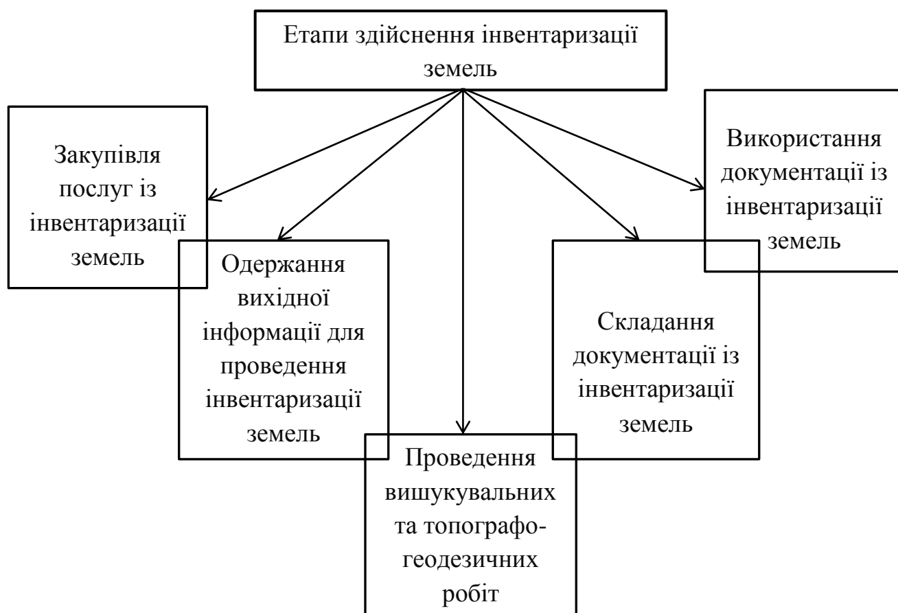
Рис. 1 – Етапи проведення інвентаризації земель

Інвентаризація земель - періодична перевірка фактичної наявності, стану та умов використання земель та відображення змін на планово-картографічних матеріалах. Практичне здійснення інвентаризації земель має здійснюватися у п'ять основних етапів (рисунок 1).