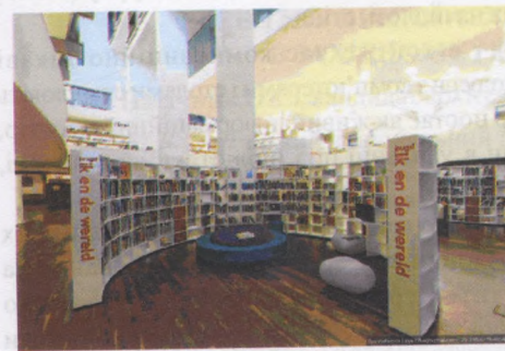
Рис.1. Центральна бібліотека Амстердама.

Яскраві сполучення, контрастні кольори надають приміщенню більшу виразність, але можуть викликати й психічний стрес. Тому їх варто використовувати дуже обережно, у невеликих площинах, у вигляді яскравих