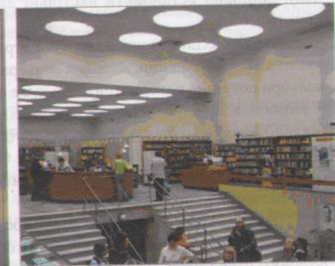
Рис.4. Бібліотека в Выборзі.