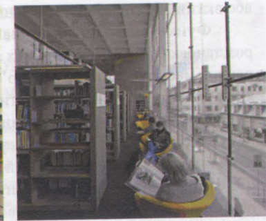
Рис.2. Бібліотека в Турку.