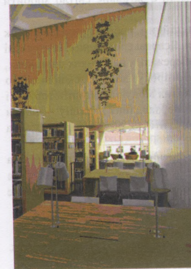
Рис.3. Бібліотека Турку.