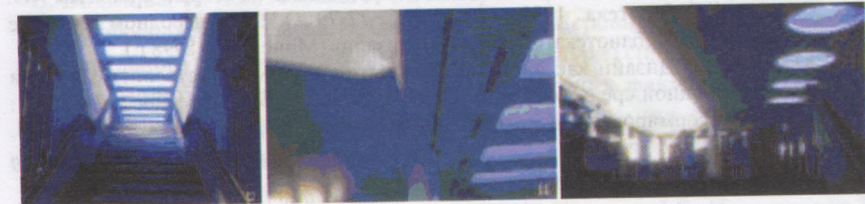
Рис. 5,6,7. Фрагменти стелі з різними пристроями верхнього світла.