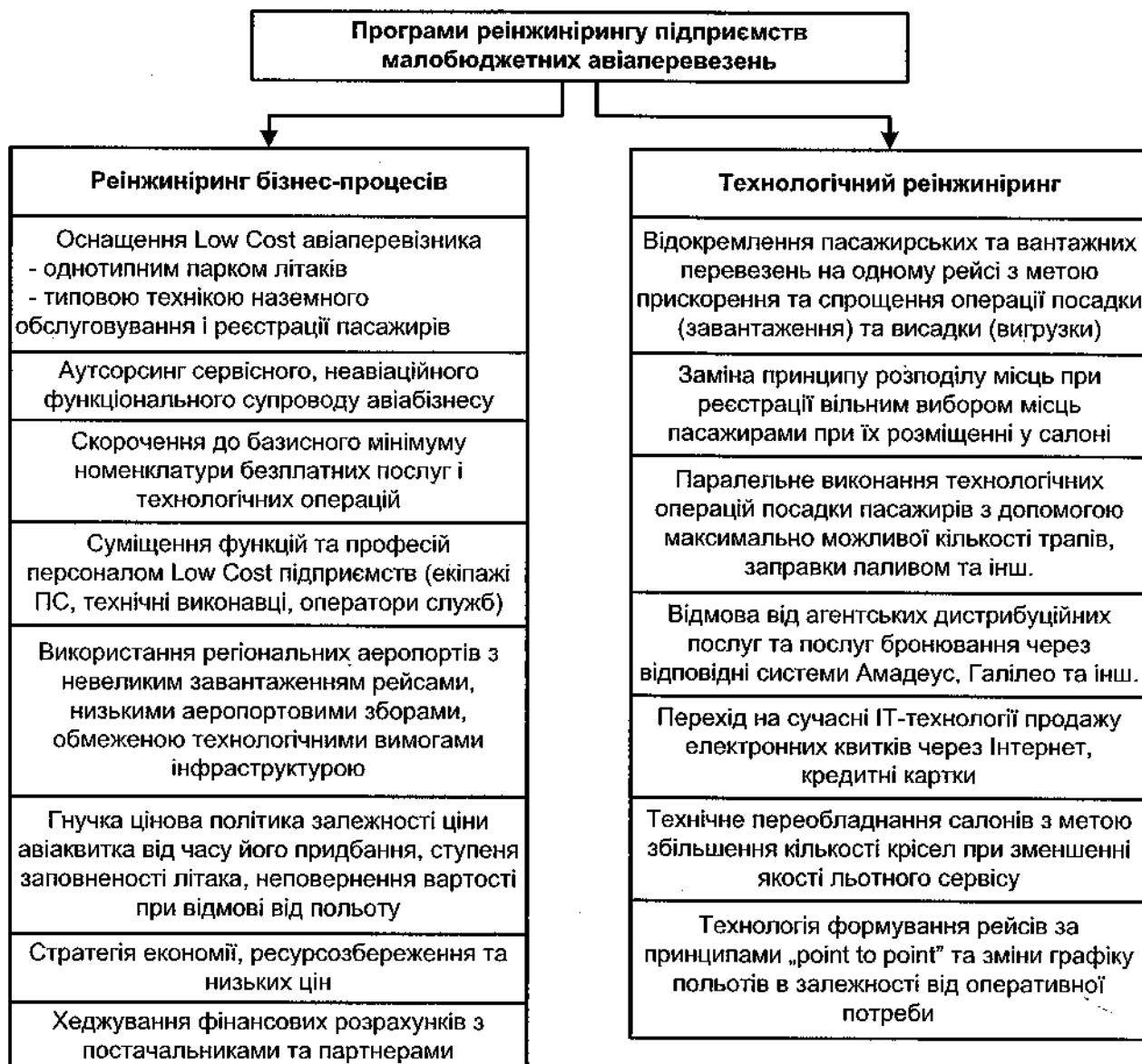
Рис. 2. Основні напрями реінжинірингу

конкурентоздатність малобюджетних авіапідприємств, програми кооперації з іншими перевізниками та шляхи залучення нових категорій пасажирів.