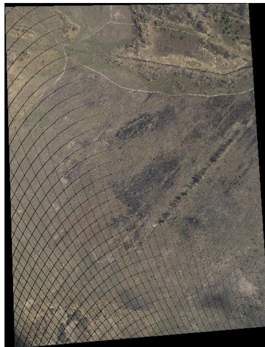
Рис. 3. Приклад проектування фотографії на площину

Приклад спроектованої фотографії можна побачити на рис. 3.