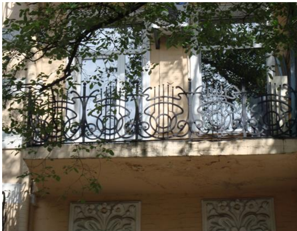
Рис. 1. Фрагмент фасада здания, ул. Гоголевская,10, Киев

модерн, отвергал и нарушал прямолинейное очертание верхней границы, разделяя ее целостность. С одной стороны, это снижало эргономические качества ограждений, с другой - визуально подчеркивало динамику декоративного рисунка (рис.1).