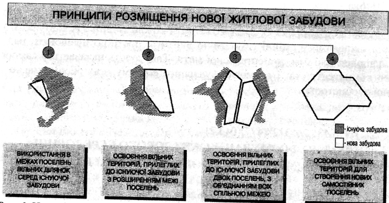
Рис. 1. Нове будівництво при формуванні нових та розвитку існуючих поселень між службами замовників

Для вирішення проблеми розселення переселенців необхідно використовувати фаховий підхід до архітектурного проектування, що вимагає теоретичного осмислення та практичного втілення досліджень, проведених науковцями та практиками-архітекторами. Прикладом може бути досвід, набутий при переселенні громадян за Чорнобильською будівельною програмою, унікальний досвід проектного та будівельного експерименту архітекторів та будівельників при формуванні та реалізації архітектурно-планувальних рішень у надзвичайно короткі терміни [1]. У зв'язку з цим необхідно проаналізувати цей досвід, а також запропонувати можливість його використання у ситуаціях швидкого реагування. Виявлено, що вжиті заходи дали змогу вже у той же 1986 рік Чорнобильської катастрофи надати дах усім евакуйованим (рис. 1), але для належного їх розміщення та створення нормальних умов життя протягом 1987 року продовжувалось будівництво багатоповерхових та садибних будинків. Так до кінця 1986 року було