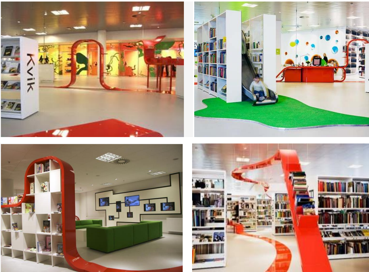
Рис. 1 Інтер'єри Центральної бібліотеки у торговому центрі «The Metropole», м. Хйорінген, Данія.

Так, наприклад, в Центральній бібліотеці у торговому центрі «The Metropole», м. Хйорінген (Данія) такою дизайнерською «фішкою» є яскрава червона стрічка, яка в'ється через увесь бібліотечний простір, пробиваючи навіть стіни, підлогу і книжкові шафи (рис.1). Направляюча стрічки є «фізичною комунікативною структурою», яка запрошує відвідувачів дослідити певну бібліотечну область.