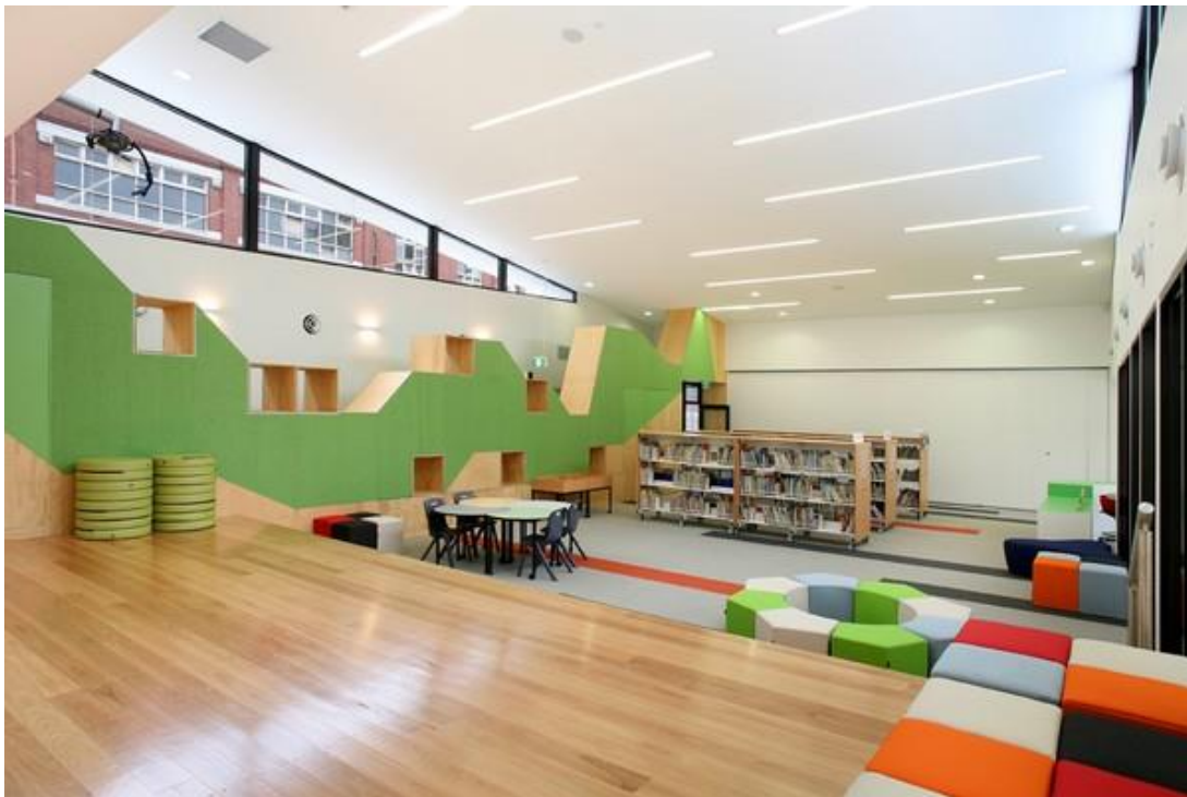
Рис. 2. Студентська і шкільна бібліотека ім. Святого Іосифа, Мельбурн, Австралія.

Інтер'єр студентської і шкільної бібліотеки ім. Святого Іосифа (Мельбурн, Австралія) максимально функціональний і розрахований на вікову категорію учнівських груп (рис. 2). Відсутній так званий «поділ на зони», немає зайвих стін-перегородок, практично відсутній декор.