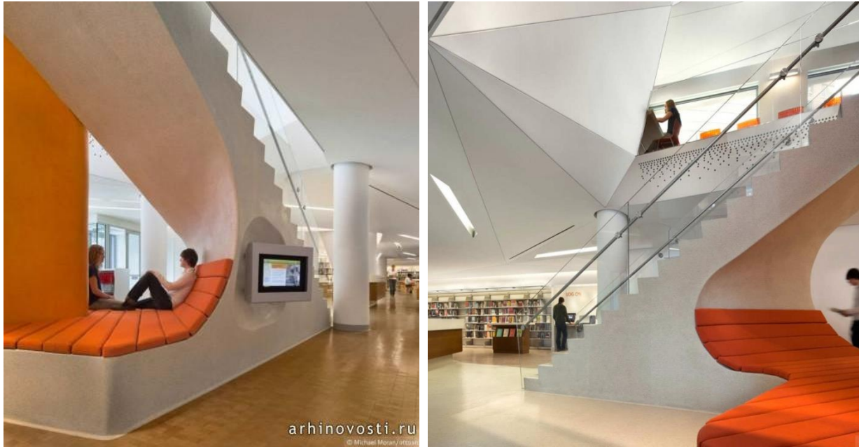
Рис.3. Рекреаційний простір громадської бібліотеки, Нью-Йорк, США

проектуванні бібліотек, є забезпечення їх екологічності. Так, наприклад, інформаційні джерела звертають увагу на те, що громадська бібліотека в районі Battery Park City Нью-Йорка (рис. 3) є найбільш екологічною в місті [2].