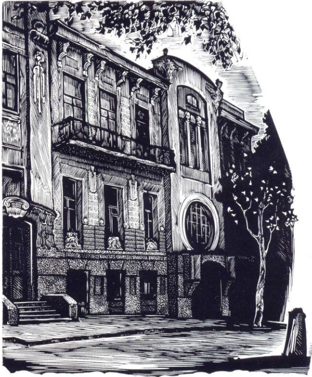
Рис. 3. Будинок в стилі «модерн»

розташовані на Глибочицькій вулиці, яка тягнеться вгору, на Соляній, де будиночки стоять так наче вони поставленні тимчасово. На Татарці ми бачимо огорожену цілою низкою прибудов, на Половецькій вулиці де будиночки наче скульптури виліпленні із якогось пластичного матеріалу, вона наче іграшка виліплена якимось малюком.