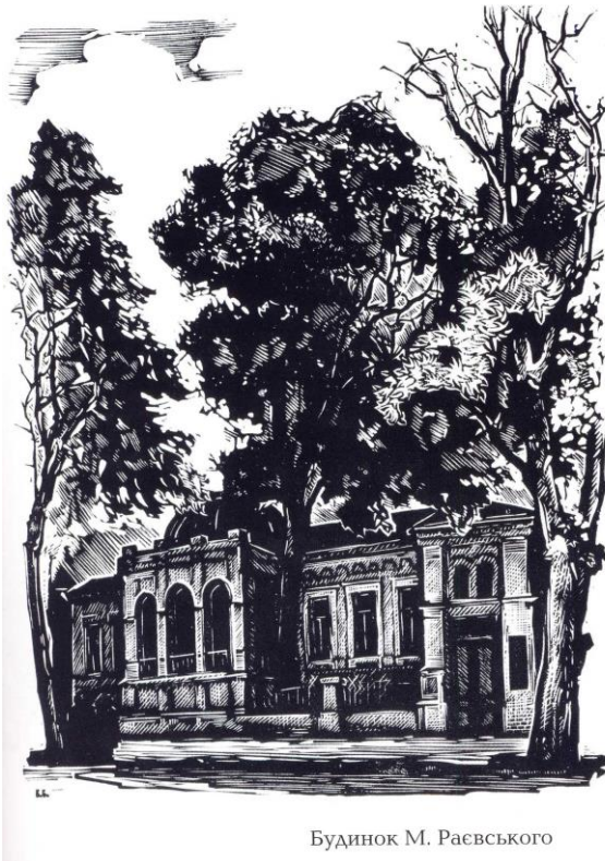
Будинок М. Раєвського

він зображений ще до того коли на ньому був зроблений ремонт. Ми бачимо його досить широким і не таким, який він є сьогодні. Будинки на ньому іще стоять у повній своїй красі і не «впорядковані» сучасними будівельниками. Це і музей М. Булгакова, щоправда дещо не звичному ракурсі, вид з двору, і будинки коло Річарда, правда сьогодні їх важко впізнати, наскільки «красиві», будинок театру і інші будинки і будиночки коло них.