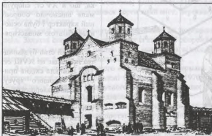
Рис. 2. Успенська церква Зимненського монастиря. 1495. Перспектива. Реконструкція Г. Логвина

завершила процес формування монастиря-фортеці. Форма плану обителі свідчить про те, що її будівничі не тільки були обізнані з досягненнями фортифікаційного мистецтва свого часу, а й могли творчо опрацювати тип укріплень правильної геометричної форми та застосувати його безпосередньо до умов місцевості. План монастиря близький до прямокутника, витягнутого зі сходу на захід. При цьому західна сторона більш прямолінійна, а північна, до складу якої входять північна стіна келій і північна стіна Успенського собору, утворює ламану лінію.